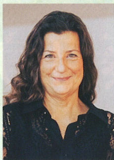
ハイケ・ヤニック (ヴァイオリン) Heike Janicke

かつて、ブラームス、ドヴォルジャークなどが自ら指揮したドレスデン・フィルハーモニー管弦楽団は、古都ドレスデンの名門オーケストラである。ドレスデン・フィルハーモニー弦楽三重奏団は、このドレスデン・フィルのトップメンバーによって1996年に結成され、ザクセン派の弦楽の伝統と新しい時代が要求する多様な要素を融合し、その個性のある演奏が世界的に高く評価されている。