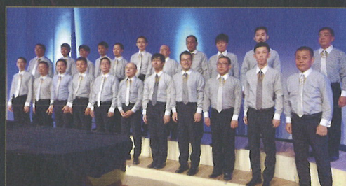
男声合唱団 Ein Prosit!